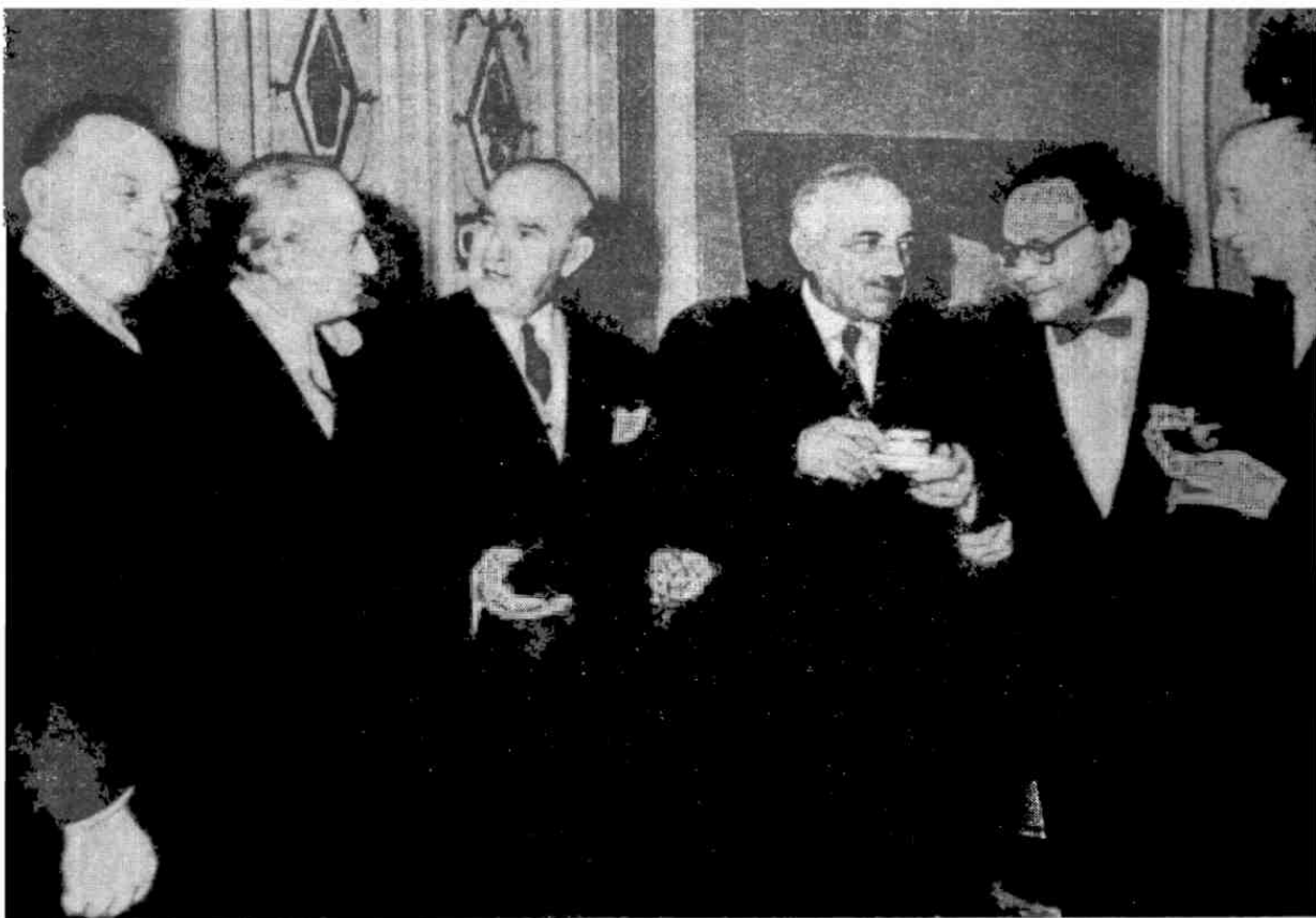
Б. Лятошинський серед членів журі Першого Міжнародного конкурсу ім. П. І. Чайковського в Москві, 1958 рік.

Сполучної партії тут немає — одразу вступає лірико-драматична побічна тема. Тема мрійлива, тендітна, дещо сумна. У мелодії велика кількість раптових зламів, несподіваних зворотів напрямку руху, від чого складається враження якоїсь хворобливості. Тональна будова тем складна. Партія фортепіано умовно написана в сфері F, а скрипка звучить атонально. Цей розділ сприймається, як скорботний роздум.