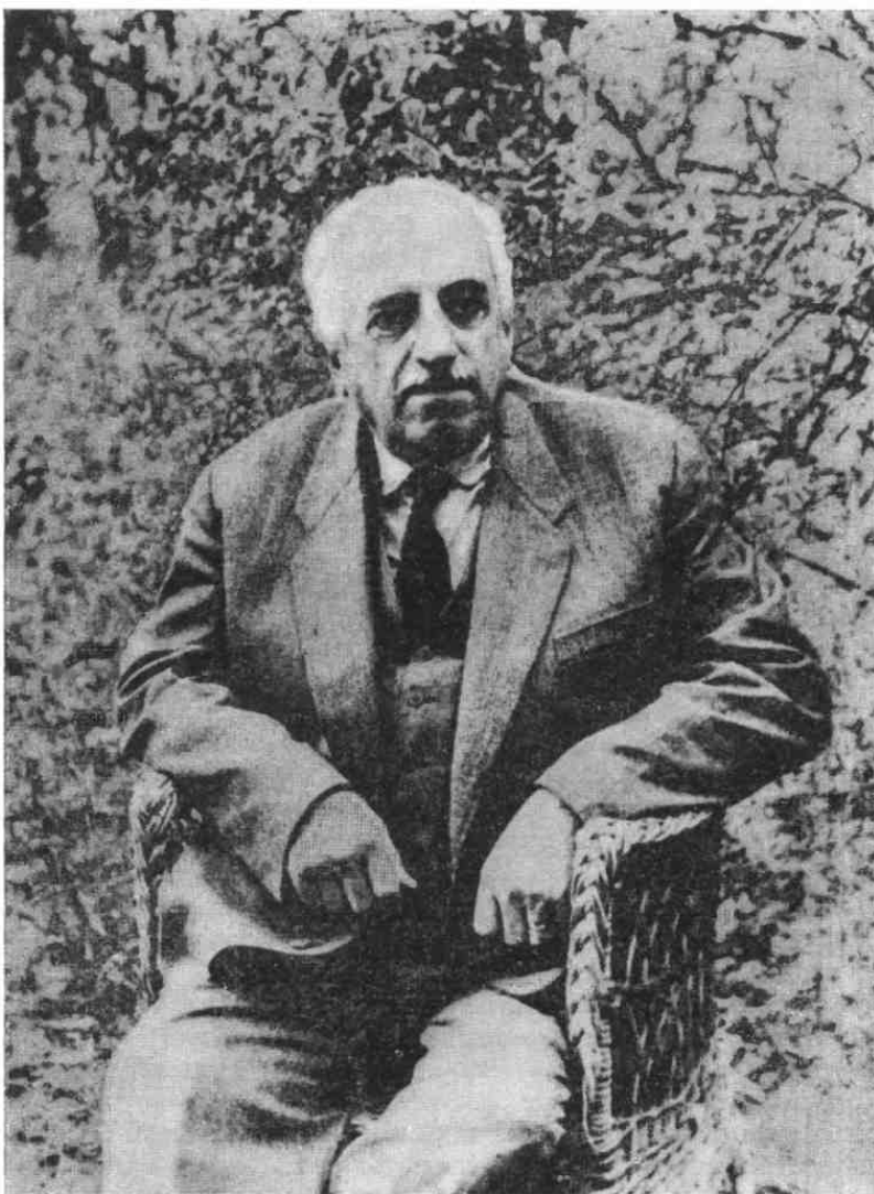
Б. Лятошинський на дачі у Ворзелі, 1966 рік.