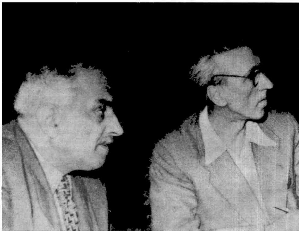
І. Лятошинський і Д. Кабалевський.

ів). Навіть у такому творі, як «Поєма возз'єднання», задуманому сюїтно-святковому характері, явно відчувається стрункість і логіка композитора драматичного напрямку мислення.