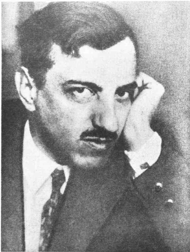
Б. Лятошинський. Кінець 30-х років, Київ.