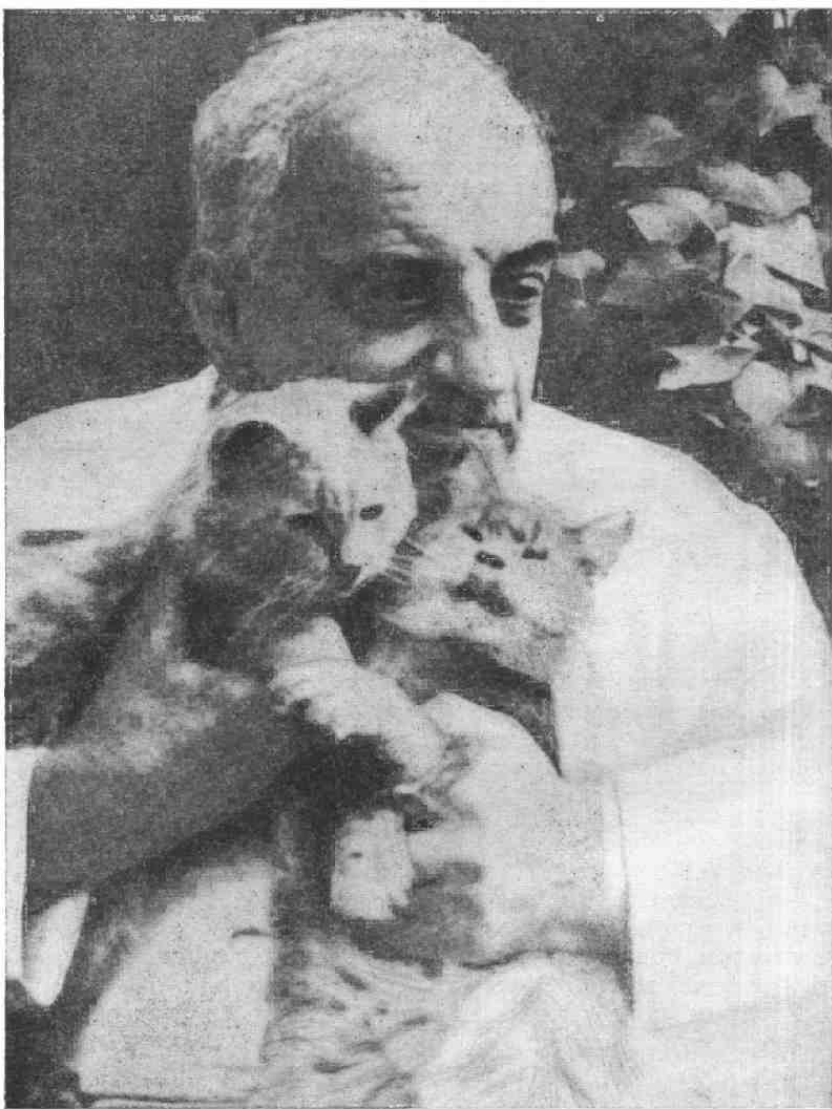
Б. Лятошинський. 1955 рік, Ворзель.