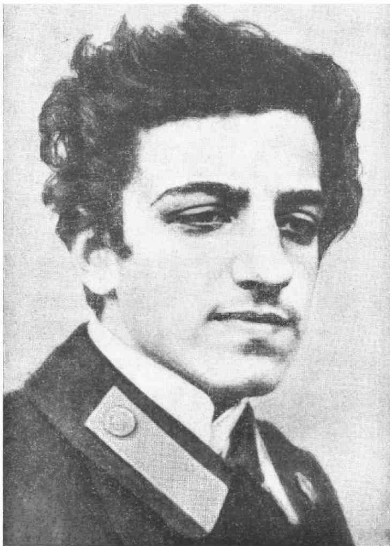
Б. Лятошинський. 1913 рік.